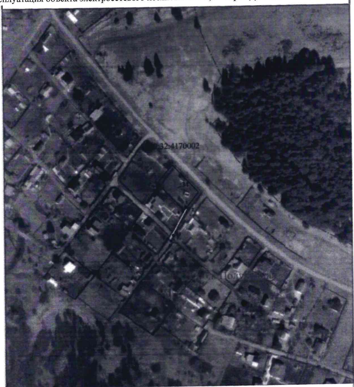
СХЕМА РАСПОЛОЖЕНИЯ ГРАНИЦ ПУБЛИЧНОГО СЕРВИТУТА Эксплуатация объекта электросетевого хозяйства ВЛ-0,4 кВ ф.1 (сущ.оп.№8-8/1) от ТП- 41442

Приложение № 1 к распоряжению комитета имущественных отношений администрации Пермского муниципального округа от 24.03.2025 № 903